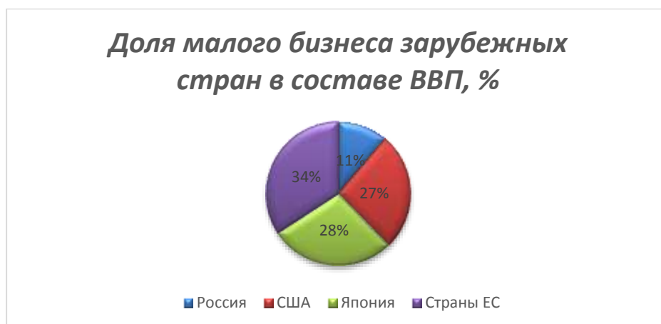
Рис. 2. Доля малого бизнеса зарубежных стран в составе ВВП, %

Развитие малого бизнеса в России характеризуется крайней противоречивостью и подошло к такому рубежу, когда объективно