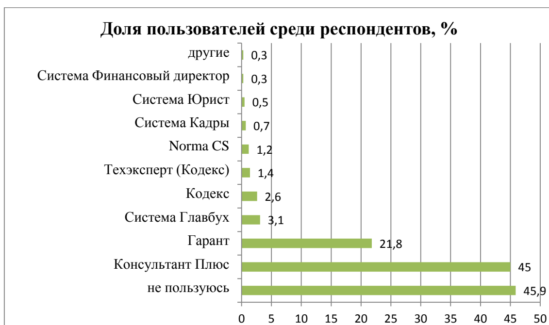
Рис. 2. Популярность справочно-правовых систем у пользователей

Набор официальных документов в этих системах одинаковый, отличия заключаются в комментариях к документам и интерфейсе, который включает систему поиска и представления нужной информации. В каждой из систем существует несколько вариантов поиска: по словам, целым фразам, аббревиатуре, датам, номерам актов, ситуациям и т.д. Также системы отличаются по частоте обновления информации, стоимости инсталляции и обслуживания.