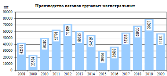
Рисунок 2 – Производственные показатели отрасли машиностроения РФ, 2018-2020 гг. [1]

Таким образом, спад производства в российском машиностроении был незначительным, несмотря на экономический кризис. Во втором полугодии динамика улучшилась из-за фактора отложенного спроса и ряда других причин. Среди машиностроительных отраслей наихудший показатель зафиксирован в автотранспортном машиностроении;