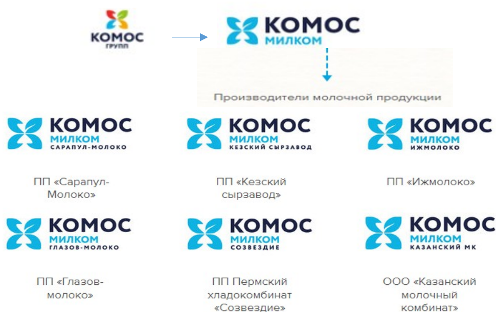
Рисунок 1 – Структура компании АО «МИЛКОМ»

Результаты исследования. Под управлением «КОМОС ГРУПП» работает единый субхолдинг АО «МИЛКОМ» по переработке молока, представленный шестью производственными площадками – «Ижмолоко», «Сарапул-молоко», «Глазов-молоко», «Кезский сырзавод», Пермский хладокомбинат «Созвездие» и ООО «Казанский молочный комбинат» (рисунок 1).