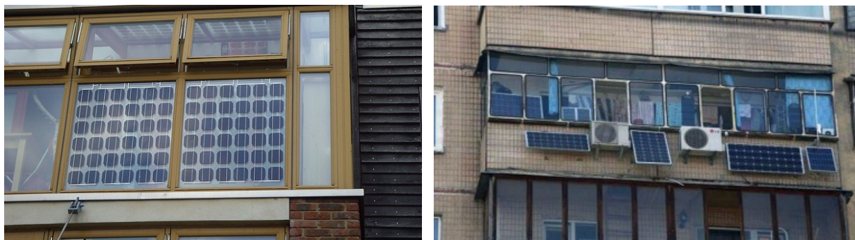
1-rasm. Deraza ortidagi va tashqarida joylashgan quyosh batareyalari.

fotoelektrik moduldan to'sib qo'yishi mumkin. Shuning uchun quyosh panellarini deraza oynalari orqasida o'rnatishni tavsiya etilmaydi (1-rasm).