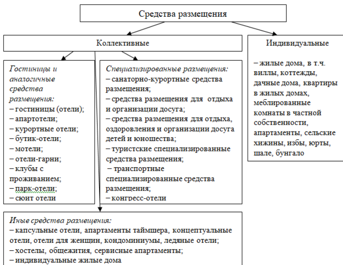
Рис. 1. Виды средств размещения

В соответствии с ГОСТ Р 51185-2014 Туристские услуги. Средства размещения, различают средства размещения различных видов [1] (Рис. 1).