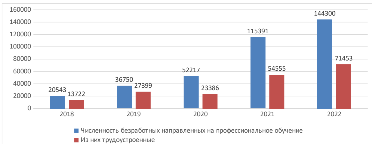
Рис. 3. Численность направленных на профессиональное обучение и трудоустроенных безработных в Республике Узбекистан, чел.