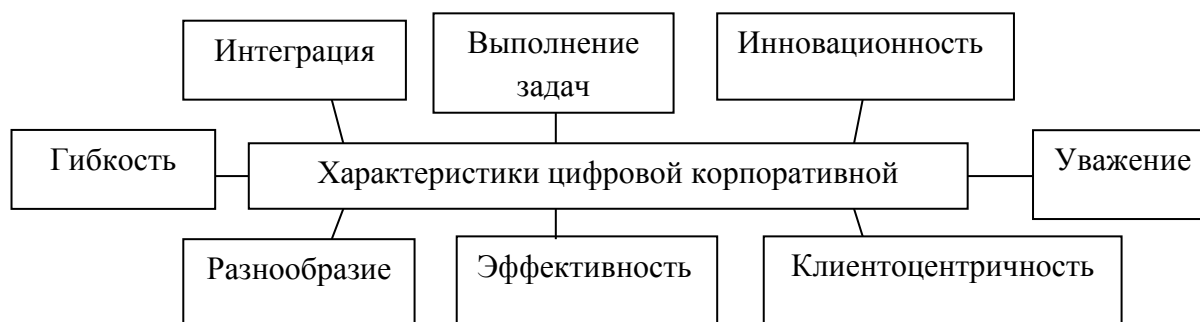
Рисунок 1. Характеристики цифровой корпоративной культуры

Внедрение цифровых инструментов в модели корпоративного управления предполагает трансформационные изменения всех уровней операционных процессов, прежде всего, основанных на создании сферы цифровой корпоративной культуры и на полном понимании стратегических целей цифровой трансформации [2]. Цифровая культура компаний, ставящих перед собой задачи развития эффективного корпоративного управления, представляет собой сферу характерных особенностей, представленных нами на рисунке 1: