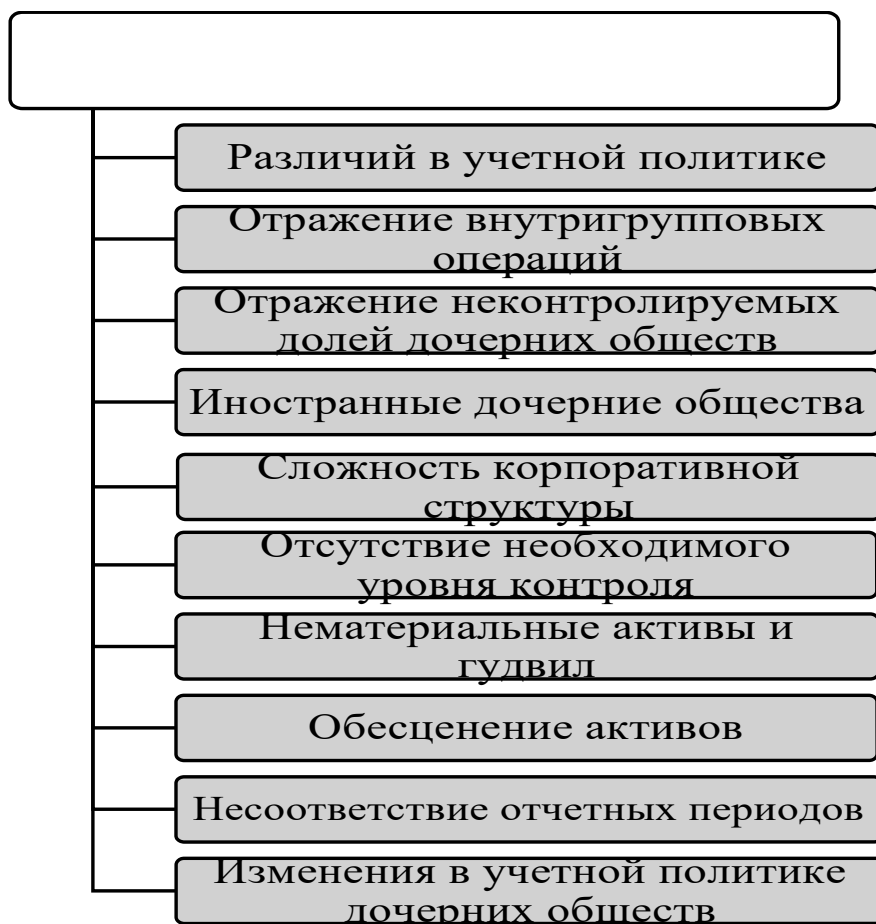
Рисунок 2 – Общие положения РСБУ и МСФО

В процессе анализа учетных политик предприятий, осуществляющих нефтедобычу и нефтепереработку, были выявлены следующие проблемы, связанные с формированием консолидированной отчетности российских предприятий см. рисунок 2.