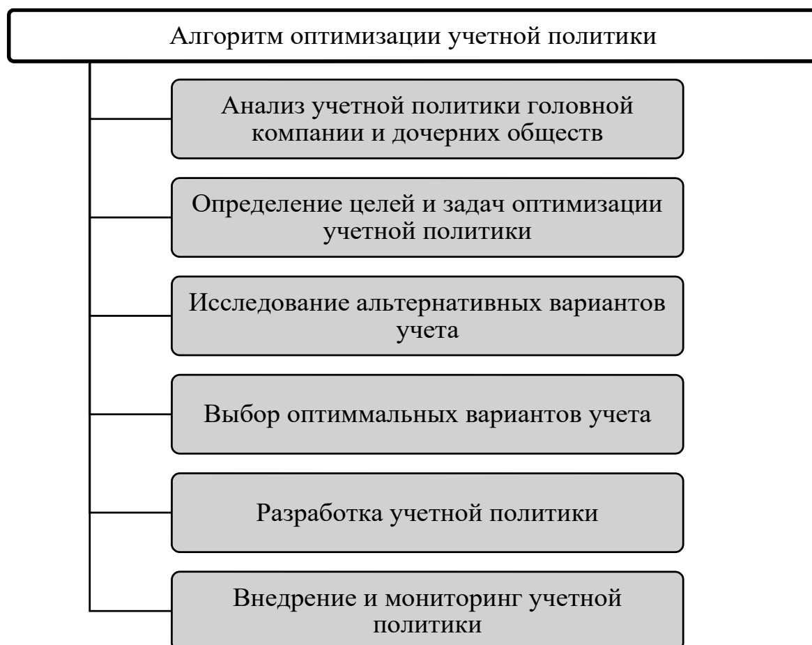
Рисунок 3 – Общие положения РСБУ и МСФО

На завершающем, шестом этапе осуществляется внедрение и мониторинг разработанной учетной политики. Данный этап посвящен внедрению и мониторингу учетной политики во всех соответствующих подразделениях. После внедрения учетной политики производится ее внедрение во всех соответствующих подразделениях головной компании и в ее дочерних обществах.