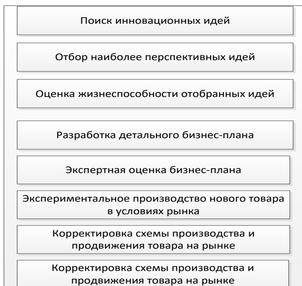
Рис2.основные этапы инновационной деятельности.

На каждом предприятии, по моему мнению, в планирование всегда должна быть включена именно разработка маркетингового плана. Я думаю, что именно это планирование будет базовым на предприятии и дальнейшее продвижение на рынке без него будет крайне трудным. В первую очередь, это гарантия того, что решения не будут приняты быстро и не будут проанализированы. Глядя на изменчивость среды, которые находится вне так же поможет план, который будет нацелен на максимальный результат с минимум потерь. Без грамотно составленного плана, как стратегического, так и маркетингового в условиях неопределенности вероятность принять неверное решение достаточно высока, но имея план и четкий анализ риск принять неверное решение уменьшается практически до минимума. Именно планирование играет важную роль в принятии решений. При верном распределении предприятию становится проще оценивать свои возможности и делить ресурсы. Это и позволяет проявляться самым наименее эффективным образом. Еще один из важных аспектов планирования является то, что на этапе становления и анализа просчитываются все риски и рассчитываются ресурсы, имеющиеся у компании, что так же вселяет уверенность в том, что, выйдя на рынок компания не обанкротится. Без