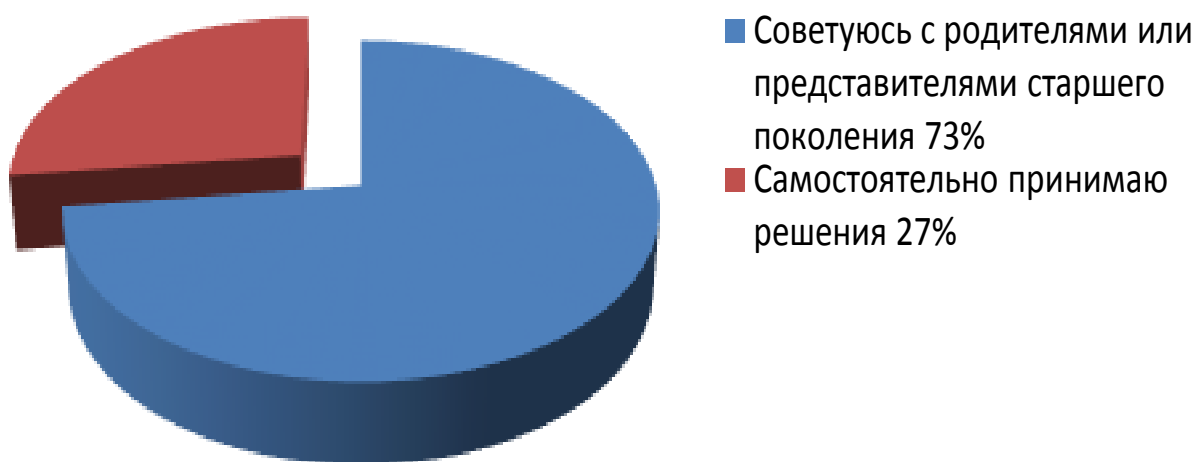
Рис. 1. При принятии определенного решения советуется ли Вы с родителями или представителями старшего поколения?

Респондентам был задан вопрос: «При принятии определенного решения советуется ли Вы с родителями или представителями старшего поколения?».