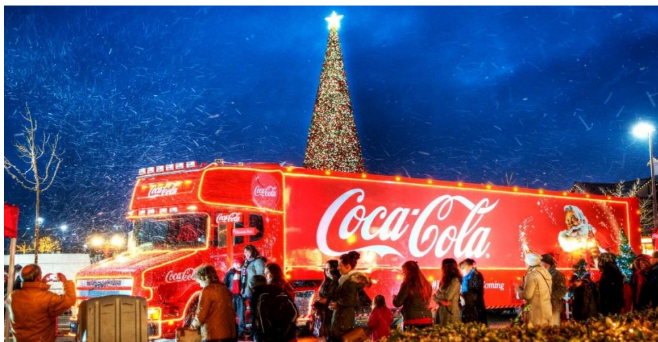
Рис. 1. Пример работы визуализации бренда

увеличивают количество пользователей, которые видят объявления, переходят на страницы и совершают покупки.