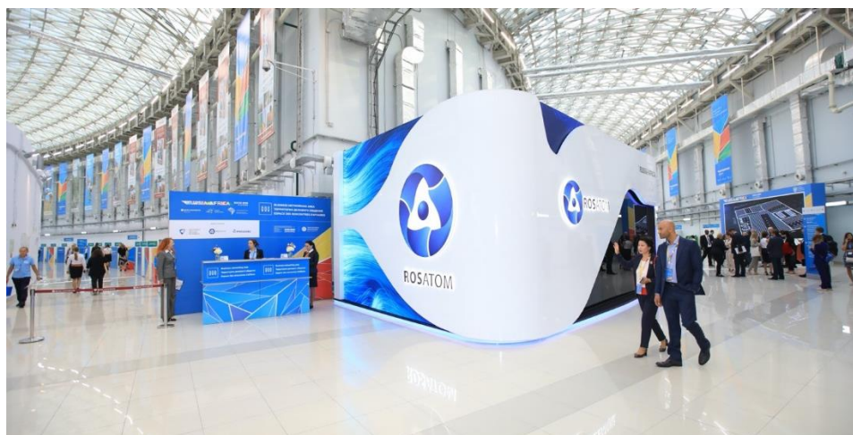
Рис. 6. Фото выставочного павильона Госкорпорации «Росатом»

других элементов рекламы, создающих его образ (brand image). Зачастую брендинг предполагает совместную творческую работу реализующей организации и рекламного агентства по созданию и внедрению в сознание потребителя конкретных эмоциональных триггеров, связанных с продуктом. (См. Рис.6)