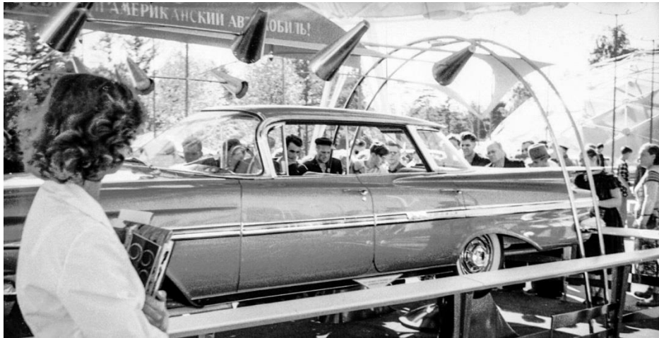
Рис.2. Фото с промышленной выставки СССР.

В условиях массового индустриального производства и потребления дизайн становится механизмом воздействия на потребителя, одним из основных средств обеспечения конкурентоспособности товара. Появление новых изобретений и производственных технологий создают предпосылки для совершенствования рынка товаров, вытеснения старых моделей новыми, которые призваны служить потребителю на совершенно новом качественном уровне, выполнять новые функции и, как результат, породить новые запросы социума.