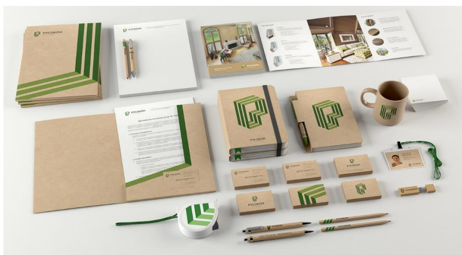
Рис. 5. Пример айдентики для предприятия.

Современные дизайн - процессы формируются на основе новых инструментов – айдентики, брендинга, маркетинга и тд. Благодаря им и создается особое впечатление, которое формирует имидж и отношение целевого сегмента рынка к продукту, улучшая восприятие образа компании ее потенциальными клиентами, что в конечном счете повышает экономические показатели ее деятельности. (см. Рис.5)