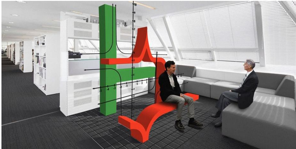
Рис. 4. Визуализация пространства офисного назначения.

Рассматривая взаимодействие дизайна с научно-техническим прогрессом, можно наблюдать различные методы влияния на глобальные проблемы человечества. Во-первых, все большее значение уделяется экологическому подходу. Дизайнерские концепты определяют направления развития современных технологий и разработки новых материалов с высокими экологическими свойствами. Сама идея сохранения природы влияет на формирование дизайн - проектов, ориентированных на глобальные задачи развития особой экологической культуры.