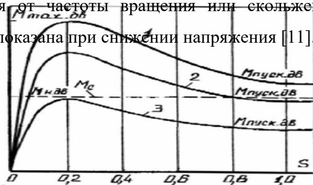
Рис.1. Влияние изменений напряжения на механическую характеристику асинхронного электродвигателя: 1 – при номинальном напряжении U_n ; 2 – при напряжении, равном 0,9U_n ; 3 – при напряжении, равном 0,7 U_n

электродвигателя от частоты вращения или скольжения ( s ). На рис.1 эта характеристика показана при снижении напряжения [11].