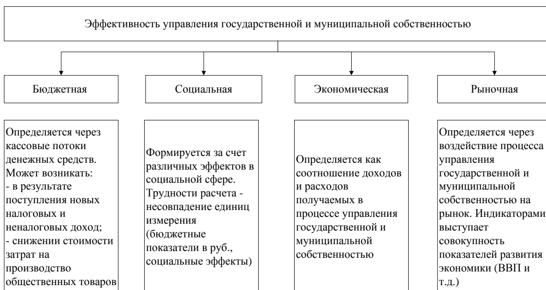
Рисунок 1 - Направления оценки эффективности управления муниципальным имуществом

В соответствие с функциями и задачами муниципальных органов по решению вопросов местного значения эффективность управления муниципальным имуществом можно оценивать показателями, представленными на рисунке 1.