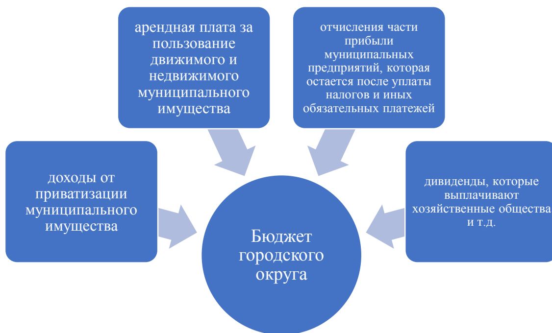
Рисунок 2 – Виды доходов от управления муниципальным имуществом городского округа

Применение процессного подхода в управлении отличается от общепринятой функциональной структуры государственного и муниципального управления. Процесс управления в органах власти любого уровня представляет собой взаимосвязь процессов по удовлетворению потребностей граждан и бизнеса. Одной из основных составляющих успешности процессного управления является личная заинтересованность первых руководителей регионов, муниципалитета рисунок 3.