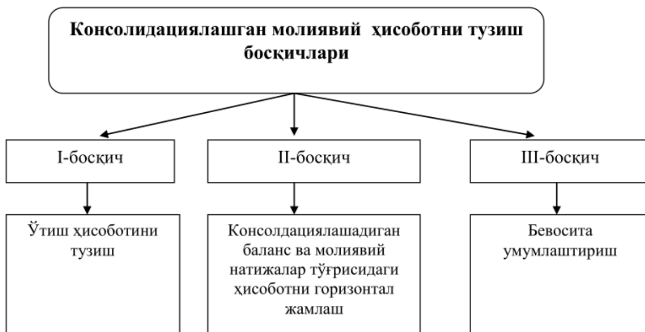
1-расм. Консолидациялашган молиявий ҳисоботни тузиш босқичлари [7].

Бош ва шўъба компаниялар ҳисоботлари маълумотларини босқичма-босқич бирлаштириш, компания туридан қатъий назар ўзларида ташкил этилган услуги ёрдамида ҳал этиш, ҳар бир услуб махсус ҳисоб тартиблари - бош ва шўъба компаниялари гуруҳини бир бутун қилиб кўрсатиш мақсадига эришишга ёрдам берадиган бирлаштириш тартибидан ташкил топади (1-расм).