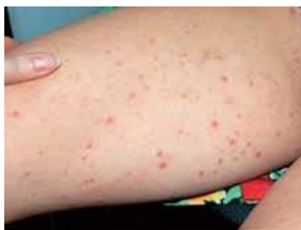
Рис. 2. Каплевидный парапсориаз с очагами поражения на коже бедер у больной С., 9 лет

При невозможности проведения диагностической биопсии диагноз уточняется в процессе динамического наблюдения (рис. 3).