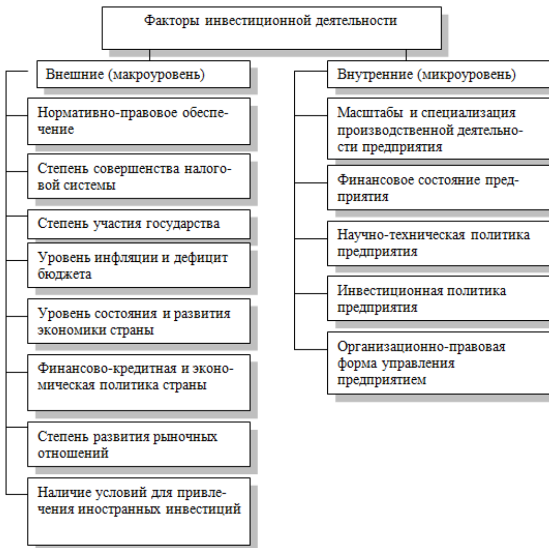
Рисунок 1 – Факторы, влияющие на инвестиционную деятельность

Так, предоставление инвесторам льгот по налогообложению, низкий уровень кредитных ставок и инфляции, участие государства в частичном финансировании целевых инвестиционных программ и другие меры, мотивируют отечественных и зарубежных инвесторов на активизацию инвестирования такой малопродуктивной и проблемной отрасли, какой выступает аграрная сфера.