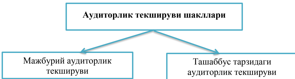
2-чизма. Аудиторлик текширувларини ўтказиш шакллари

қараб бирғбиридан фарқ қилади. Ушбу аудиторлик текширувлари буюртмачилари ҳам турлича бўлади.