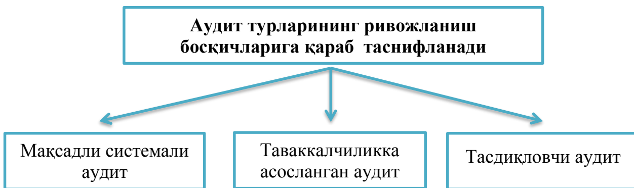
3-чизма. Аудитнинг ривожланиш босқичи бўйича таснифланиши

Меъерий ҳужжатларда мажбурий ва ташаббус тарзида ўтказиладиган аудиторлик текширувларининг аниқ объектлари келтирилган. Аудит турлари ўзининг ривожланиш босқичларига қараб ҳам таснифланади 1 (3-чизма):