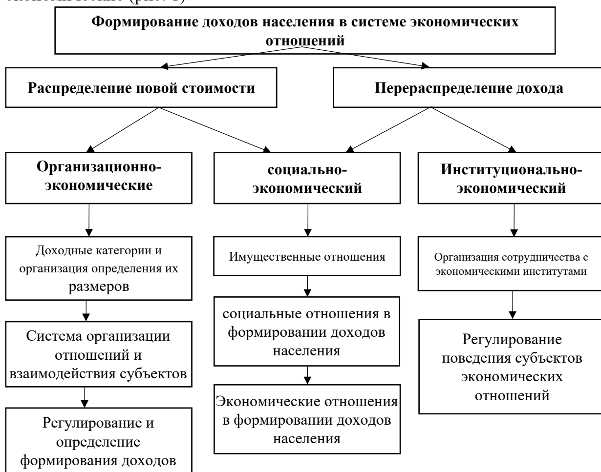
Рис. 1. Экономические отношения в формировании доходов населения 3

Экономические отношения, формируемые субъектами в процессе получения доходов населением, делятся на три вида: социально-экономические, организационно-экономические и институционально-экономические (рис. 1)