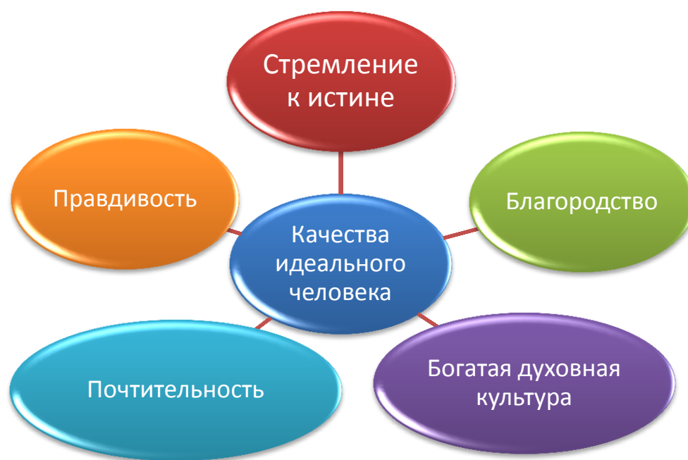
Рис. 5. Конфуций о качествах человека, сформированного воспитанием.

Он высказывал идею разностороннего развития личности, отдавая при этом предпочтение перед образованностью нравственному началу. В разработанной Конфуцием программе обучения отражена необходимость умственного, морального, эстетического и физического развития учащихся. Она предполагала изучение: письма, арифметики, морали, музыки, стрельбы из лука, управление колесницей, добродетели, политики, управления, литературы, языка. Отмечается, что в процессе воспитания и обучения надо учитывать возраст учащихся, идти от простого к сложному.