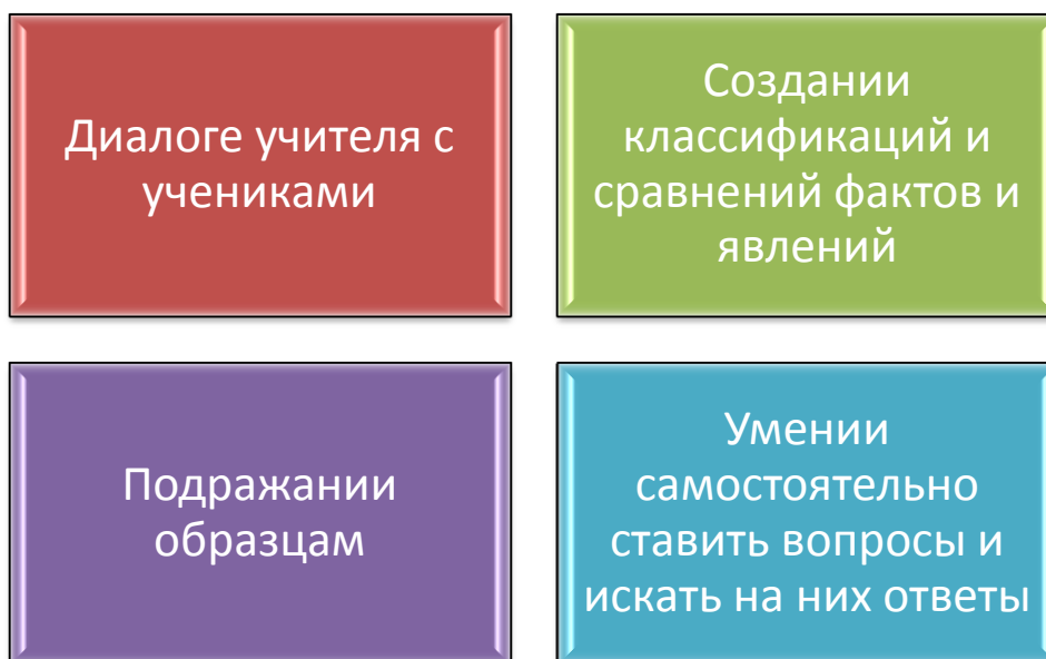
Рис.3. Методика преподавания в школе Конфуция

Конфуций отмечал, что прочность и жизненность общества покоятся на правильном воспитании его членов, согласно их социальному статусу. По мнению Конфуция, природное в человеке – это материал, из которого при правильном воспитании можно создать идеальную личность. И указывал, что возможности различных людей от природы неодинаковы. По природным задаткам Конфуций различал: