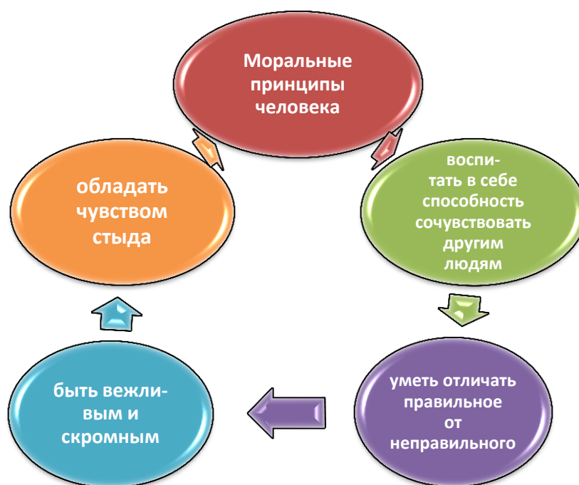
Рис.2. Конфуций о моральных принципах человека.

Классическое китайское образование базировалось на книгах конфуцианского канона. Методика преподавания в школе Конфуция