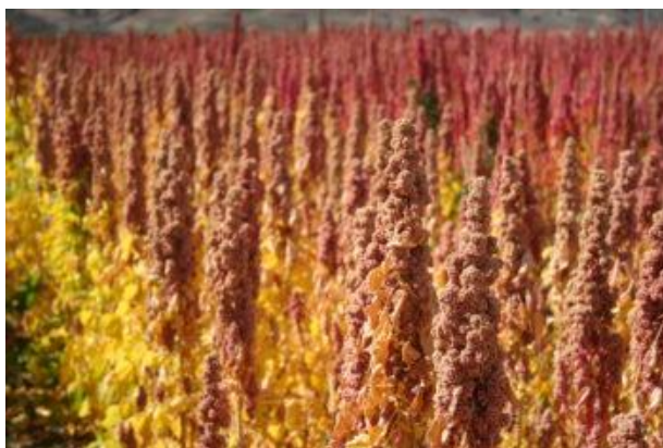
1-rasm. Amarant o'simligi

Amarant o'simligi qishloq xo'jaligida yigirma yillardan ortiq davr mobaynida yanada ham mashhurlikni qo'lga kiritmoqda. Kombikormda uni qo'llash sekin ro'y beryapti, chorvachilar ehtiyot bo'lishga harakat qilyaptilar, chunki bir necha o'n yilliklar oldin qishloq xo'jaligida amarantni ishlatish omadsiz tajribasi uzoq vaqt davomida ozuqa ishlab chqaruvchilarni ham va chorva xo'jaliklarni ham bu o'simlikdan yuz o'girtirdi. Shunga qaramay hozirda ko'plab fermerlar va dehqonlar amarantning ozuqa navlari bug'doy, soya, arpa va boshqa ananaviy kulturalardan ko'ra ko'proq foydali ekanligini tan olyaptilar. [2]