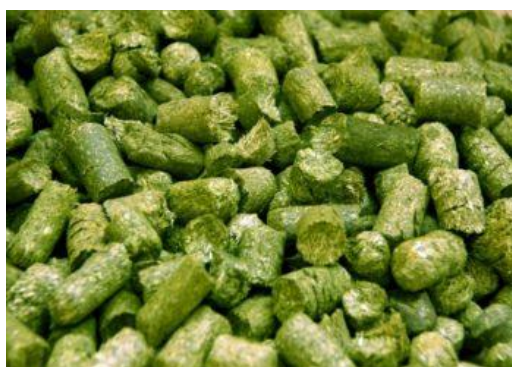
3-ram. Ozuqa granulari.

Amarant yashil massasidan o'simlik uni va o'simlik granulari vitaminlar soni jihatidan cho'chqa, buzoq, tovuq va quyonlar uchun ishlatiladigan standart kombikormlar: o'simlik uni va granulalardan ustundir. Mikro- va makroelementlar miqdori va tarkibida kletchatka jihatidan amarant yashil massasi uni turli o'simlik unlari bilan solishtirishi mumkin.