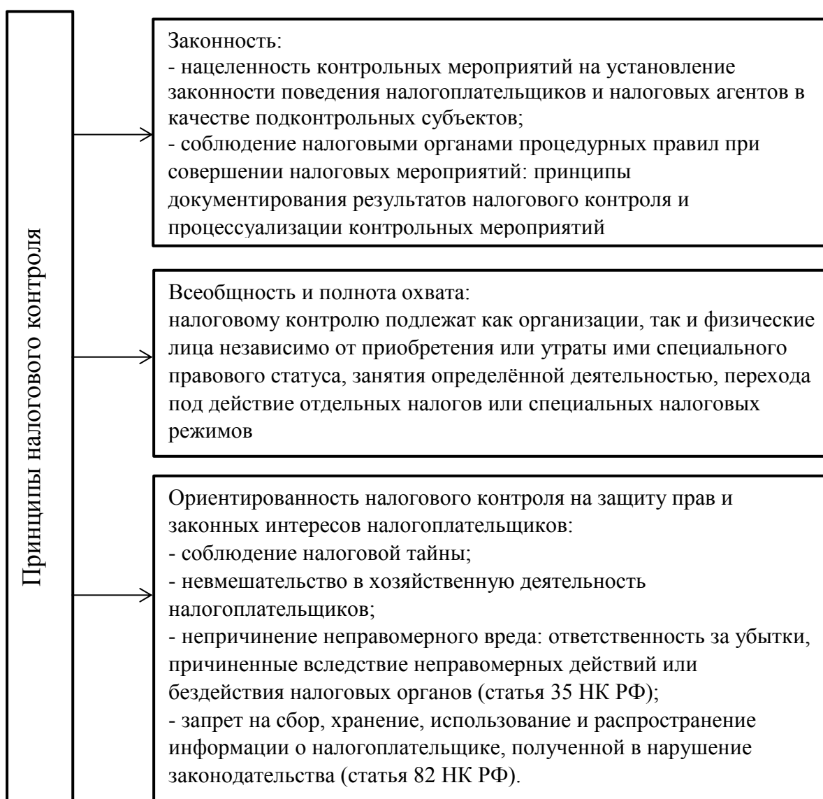
Рисунок 2 – Основные принципы налогового контроля

Субъекты налогового контроля при осуществлении ими контрольных мероприятий в сфере налогообложения должны руководствоваться определенными принципами. Основные принципы, на которых основывается налоговый контроль в Российской Федерации, систематизированы на рисунке 2.