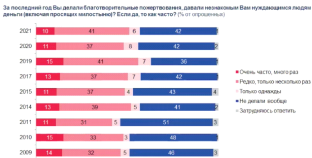
Рисунок 1 – Динамика частоты совершения денежных пожертвований [10]

Отношение в благотворительности в современном мире, и в России в том числе, в целом положительное, разделяемое многими бизнесами и гражданами, но все еще недостаточно распространенное, меняющееся год от года. В конце 2021 года, по данным мирового индекса благотворительности, Россия поднялась на 67 место благодаря повышению трех ключевых показателей отношения к благотворительности, а именно денежных пожертвований, помощи незнакомым людям и волонтерству [13]. Тем не менее, численность людей, не делающих пожертвования в течение года, возросло, по сравнению с прошлыми годами — с 36% в 2019 году до 42% в 2021-м. И это говорит о том, что процент людей, совершающих денежные пожертвования, все же стал меньше (рисунок 1).