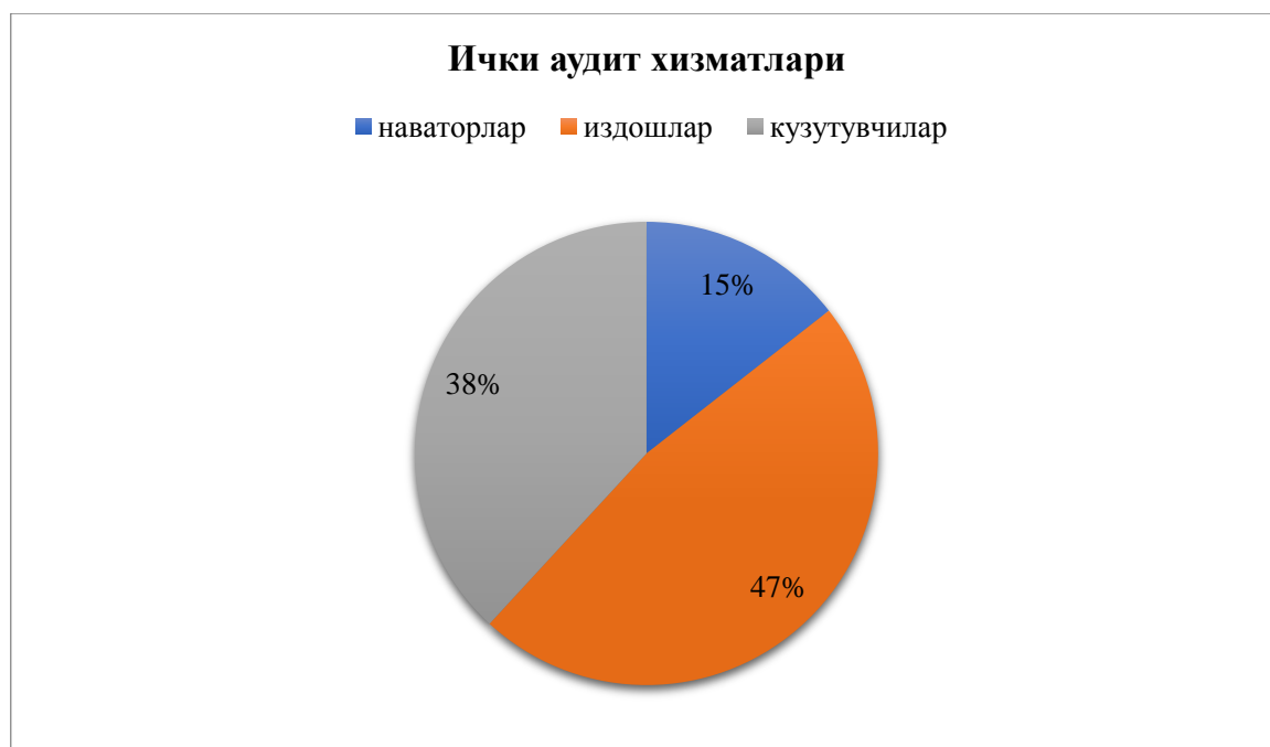
2-расм. Ички аудит хизматларини гуруҳлари

Алоқа хизматларини кўрсатувчи субъектларда ички аудитни ташкил этиш ўзига хос ёндашувни талаб этади. Чунки алоқа хизматлари бу ҳам моддий ҳам номоддий кўринишга эга бўлган хизматларни ўзида жамловчи фаолият туридир. Бундан ташқари ички аудитордан ҳам ахборот технологиялар соҳасидан юқори билимга эга бўлишни талаб қилади. Шу нуқта назардан келиб чиқиб бир гуруҳ олимлар мутахассислар ўз ишларида янги технологиялардан фойдаланиш ҳажми ва даражасидан келиб чиқиб, ички аудит хизматларини бир нечта гуруҳларга ажратганлар: 1