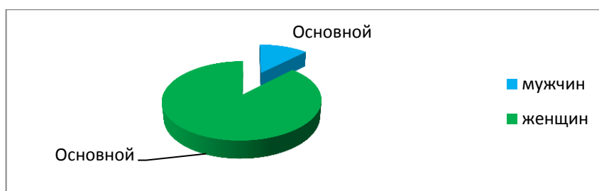
Рис.1 Гендерная характеристика ВУТ

Согласно наших данных (рис.1) заболеваемость с ВУТ чаще встречается у женщин (87,7%), нежели у мужчин (12,3%), что совпадает с литературными данными, где указано: сегодня следует особое внимание уделять не только мужчинам, как это принято в последние годы, но и женщинам трудоспособного возраста [5].