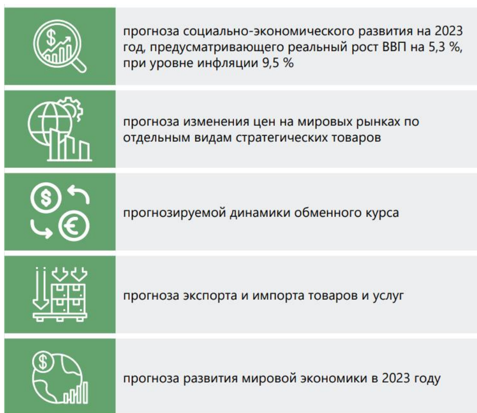
Рисунок 2. Прогноз доходов Государственного бюджета на 2023 год [2, 9].

При формировании высоких темпов макроэкономических показателей основным фактором является формирование и целенаправленной функционировании налоговой системы. При этом хотели бы уточнить что такое налоговая система. Налоговая система – это совокупность взаимосвязанных налогов, взимаемых в стране, и методов налогообложения, сбора и использования налоговых поступлений, а также налогового администрирования. В развитых странах доля налогов составляет основную часть доходной части государственного бюджета. Налоговое регулирование является важным элементом бюджетно-налоговой и экономической политики, преследуя следующие главные цели: достижение постоянной устойчивости экономического роста цен, обеспечение социальной защиты населения, создание равновесия во всех сферах экономической деятельности. [3, 9]