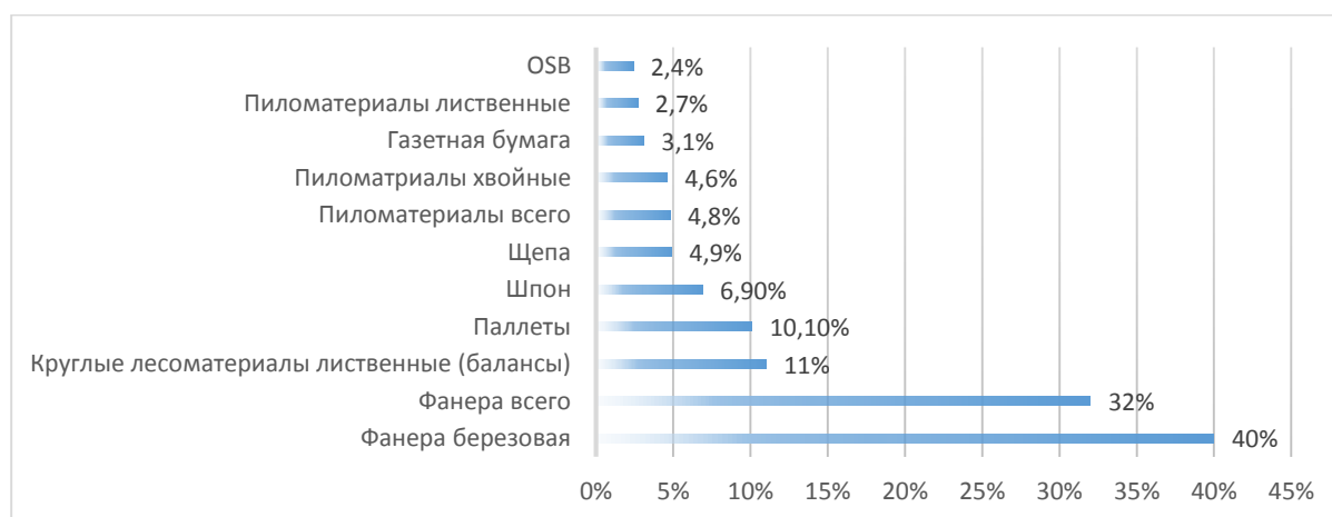
Рисунок 1. Доля российской лесной продукции в общем объеме потребления на рынках стран ЕС(%)

Результаты исследования. Как известно, Россия столкнулась с седьмым пакетом санкций, который был утвержден 21.07.2022 Европейским союзом. В результате было введено эмбарго как на прямой, так и косвенный ввоз товаров, работ, услуг, на покупку золота, при условии его происхождения в Российской Федерации. Так же запрет коснулся и экспорта. Наряду с этим набирают обороты ограничения по приему депозитов у юридических лиц и организаций, которые имеют учреждение в третьих странах, но расположены на территории России. Из-за введенных штрафных санкций около 45,8% вывоза лесной продукции пришлось на «недружественные страны».