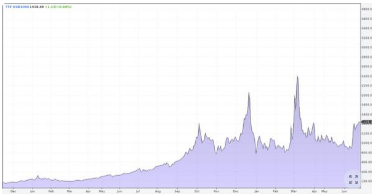
Рисунок 4. Цены на газ 2020-2022 в Европе,долл

Также, одними из главных отраслей отечественной экономики выступают нефтегазовый и металлургический сектора, которые также столкнулись с рядом ограничений. В качестве примера проанализируем Российскую газовую компанию «Газпром», для которой серьезным ударом послужило прекращение сертификации «Северного потока – 2». Наряду с этим, произошла частичная национализация некоторой собственности данной компании и запрет на сотрудничество с предприятиями Северной Америки.