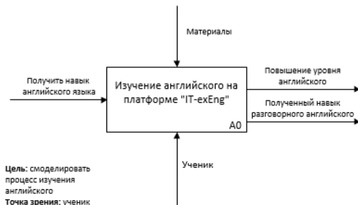
Рис 1. Контекстная диаграмма нотации IDEF0

Методология IDEF0 позволяет создать контекстную диаграмму «Как должно быть» интернет-платформы для изучения английского языка в сфере IT (Рис. 1.).