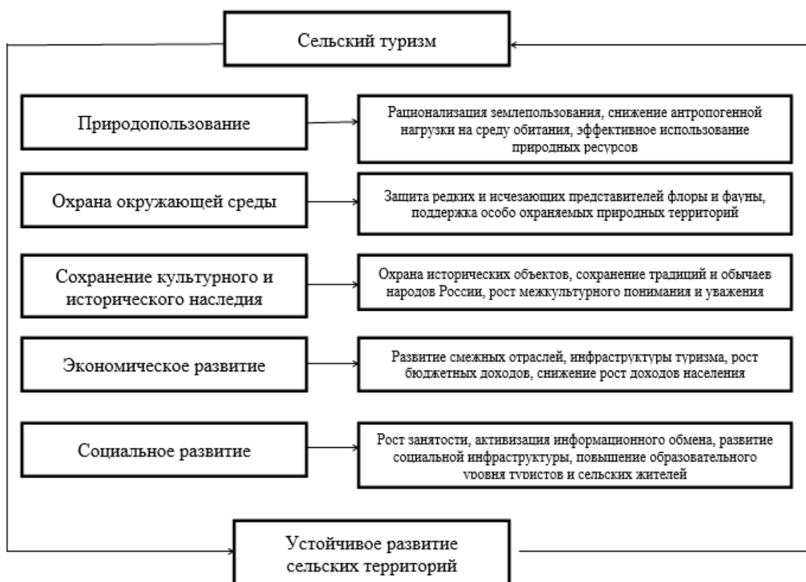
Рисунок 1. Взаимосвязь сельского туризма с устойчивым развитием сельских территорий

экологического кризиса. С развитием сельского туризма связана смена моделей природопользования, оно способствует охране природы и культуры, социальному и экономическому развитию. Эти элементы образуют системы и взаимно влияют друг на друга (рисунок 1).