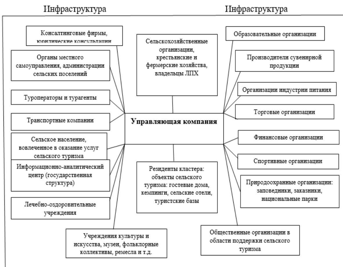
Рисунок 2. Структура агротуристического кластера

Основная деятельность кластера может предполагать: