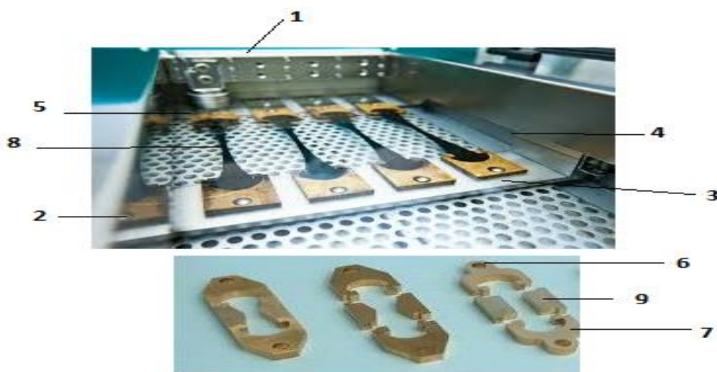
Фигура 1. Форма для подготовки дуктилометра и образцов.

удлинением и измеряется дуктилометром. Используемое оборудование: прибор дуктилометр, формы-восьмерки для изготовления проб, сито № 05, нагреватель песка, фарфоровая чаша, нож, глицерин, термометр.