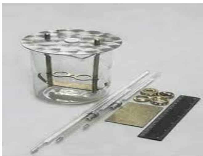
Фигура 2. Инструмент «Кольцо и мяч».

до 1200°C в течение 15 мин. На стальную пластину наносят глицерин, смешанный с тальком. Затем в кольцо заливают расплавленный битум, а после остывания его поверхность заглаживают по краю кольца горячим ножом. После остывания мастики на нее насыпают стальной шарик, а кольца помещают в специальные отверстия на штативе и погружают в воду (+С) в стеклянной емкости. Затем выдерживают 15 мин. Затем стеклянную емкость помещают на электрическую плиту с асбестовой сеткой и нагревают воду со скоростью одна минута. По мере размягчения мастики стальной шарик, обмотанный битумом, медленно стекает на нижнюю полку кольца. Температура воды в это время соответствует температуре размягчения битума. Определение температуры горения и воспламенения мастики.