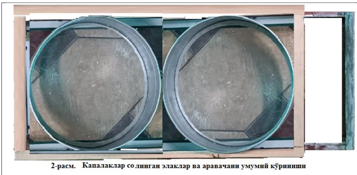
2-расм. Капалаклар солинган элаклар ва аравагани умумий кўриниши

иложи йўқлигидир. Юқоридаги камчиликларни бартараф этиш учун Олтинкўл тумани ўсимликлар карантини ва химояси ИТИ ходимлари томонидан дон қуяси тухумини элаклар ёрдамида ажратиб олишда янги мослама яратишди (1-расм).