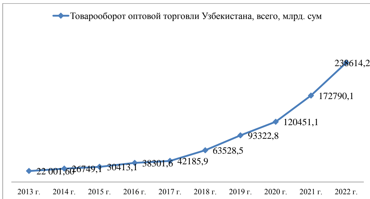
Рисунок 1. Товарооборот оптовой торговли Узбекистана, всего, млрд. сум

торговли. В частности, оборот оптовой торговли за последние пять лет увеличился почти в 4 раза. Темп роста оборота оптовой торговли также составляет 128-135 процентов (рис. 1).