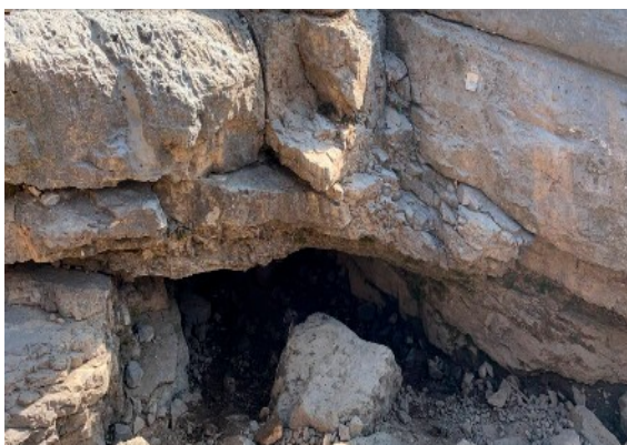
Boysun tumanidagi Machay g'ori (mil.avv. 12-6 ming yillik)