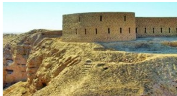
Muzrabod tumanidagi Kampirtepa yodgorligi (mil.avv.III asr)