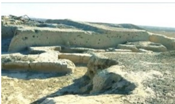
Angor tumanidagi Qo'rg'on yodgorligi (milodiy V-VII asrlar)

balandligi 10 m atrofida. XX asrning 70-yillarida arxeolog T. Annayev tomonidan ko'shkning ikkinchi qavatida qisman arxeologik qazuv ishlari olib borilgan.