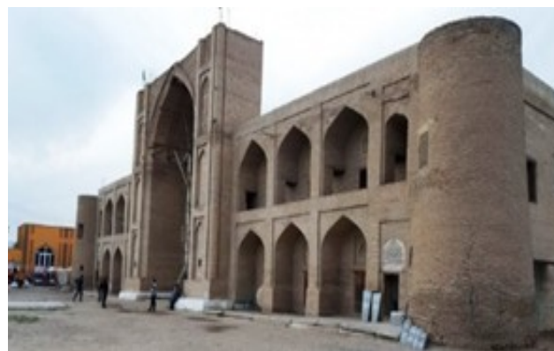
Denov tumanidagi Said otaliq madrasasi (XVI asr)