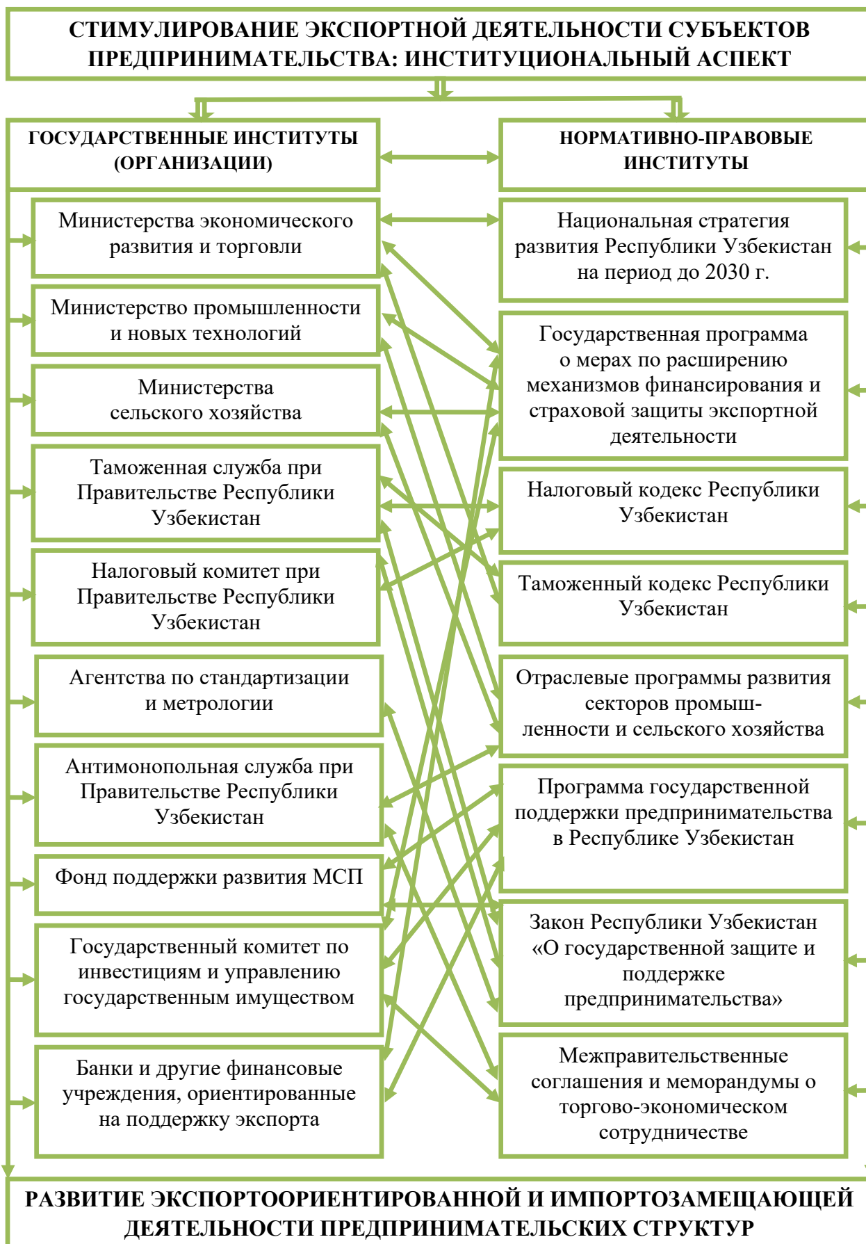
Рисунок 3. Структурная схема взаимодействия институтов поддержки экспортной деятельности предпринимательских структур