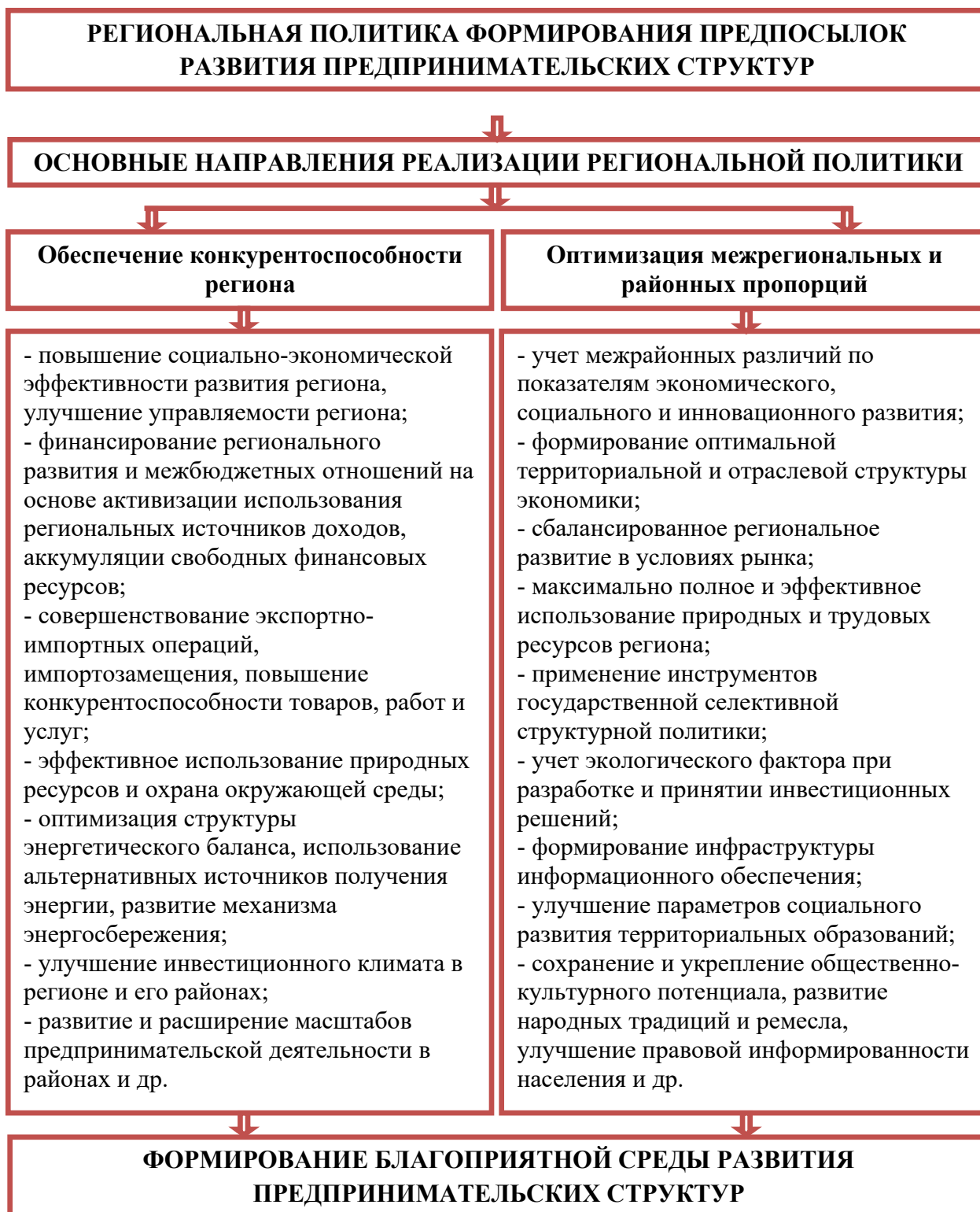
Рисунок 2. Основные направления формирования региональной экономической политики развития предпринимательства.

При этом предпринимательская деятельность, особенно малые и средние формы предпринимательства почти во всех странах без исключения пользуются государственной поддержкой. На региональном уровне