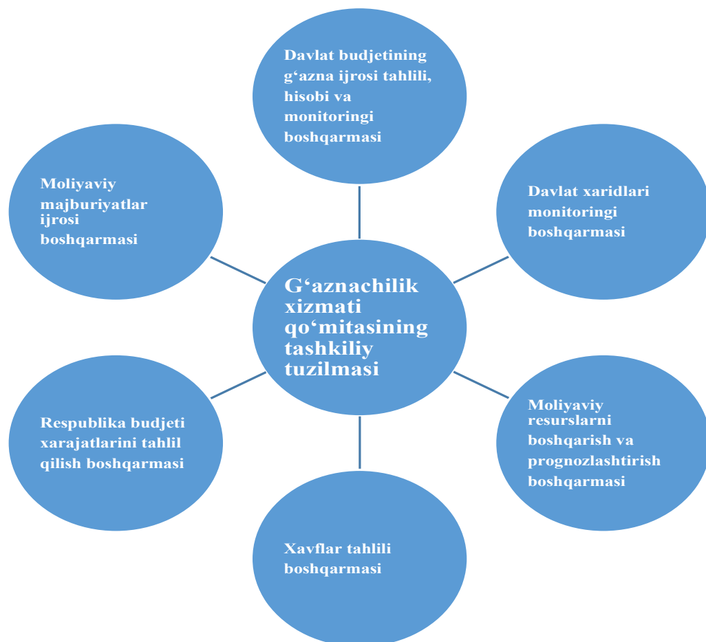
2-rasm. G'aznachilik xizmati qo'mitasining tashkiliy tuzilmasi . 2