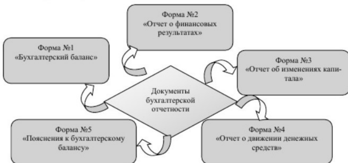
Рисунок 2. Основные документы, используемые для проведения анализа финансового состояния предприятия

Общепринятым основным источником финансовой информации считается финансовая отчетность - «это совокупность показателей бухгалтерского учета, отраженных в форме определенных таблиц, которые отражают движение имущества, обязательств и финансовое положение предприятия за отчетный период». Согласно этому положению, основными документами, используемыми при анализе финансового состояния предприятия, являются документы бухгалтерской отчетности (рис.2).