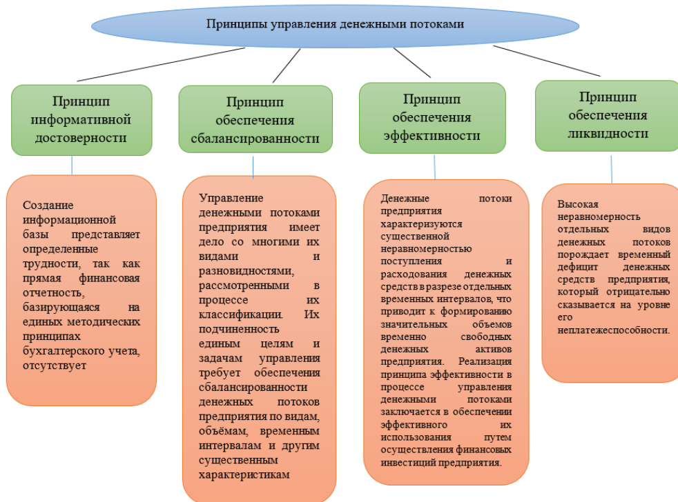
Рис. 1. Принципы управления денежными потоками

Процесс управления денежными потоками предприятия базируется на определенных принципах основными из которых являются (рис. 1):