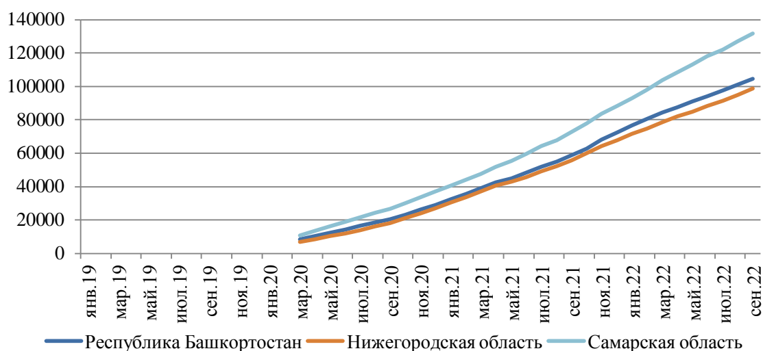
Рисунок 3 Количество физических лиц, применяющих специальный налоговый режим "Налог на профессиональный доход", в единицах

Рост численности физических лиц, применяющих специальный налоговый режим "Налог на профессиональный доход" нивелирует сокращение численности работников, занятых у субъектов МСП.