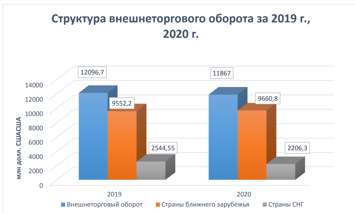
Рис. 1 Структура внешнеторгового оборота за период 2019 - 2020 гг.

На рисунке 1 представлена структура внешнеторгового оборота Свердловской области за период 2019 - 2020 гг.