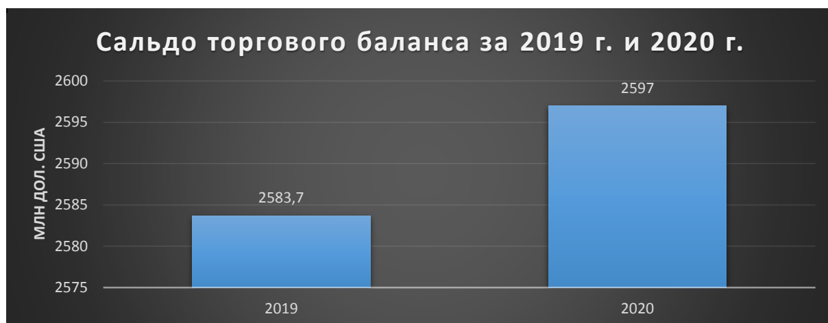
Рис. 3 Сальдо торгового баланса за период 2019 - 2020 гг.

На рисунке 3 показано увеличение сальдо торгового баланса.