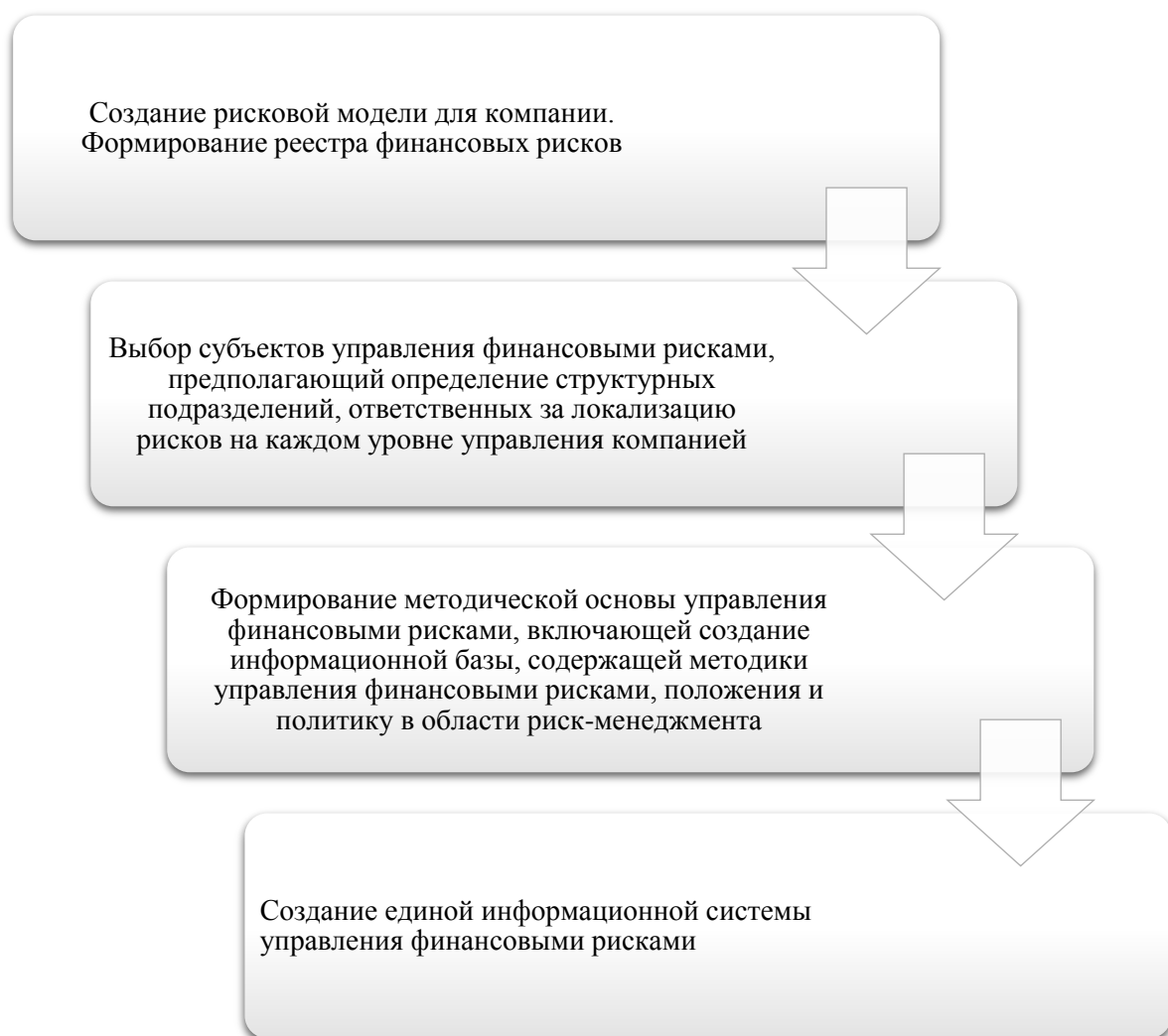
Рисунок 2. Алгоритм совершенствование информационной базы для управления финансовыми рисками компании в системе экономической безопасности

В рамках совершенствования системы управления рисками в целях укрепления экономической безопасности предприятия, предлагается совершенствование информационной базы для управления финансовыми рисками компании (рисунок 2).