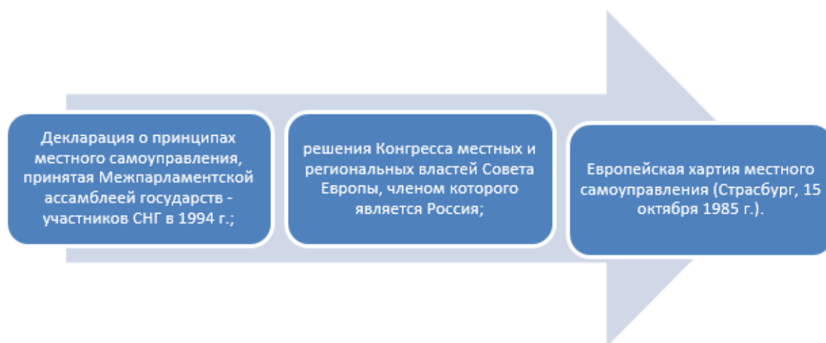
Рисунок 1 – Международные правовые акты, составляющие основу местного самоуправления в Российской Федерации [4]

Хартия обязывает государства закрепить во внутреннем законодательстве и применять на практике совокупность юридических норм, гарантирующих политическую, административную и финансовую независимость муниципальных образований. Она также устанавливает необходимость конституционного регулирования автономии местного самоуправления. Кроме того, Хартия является первым юридическим документом, гарантирующим соблюдение принципа социальной