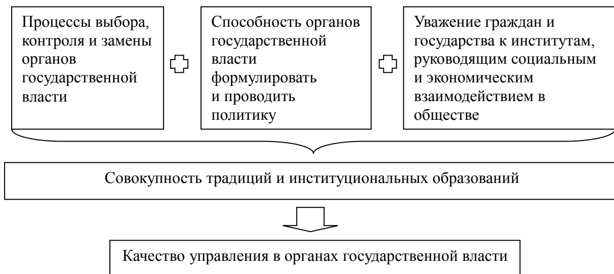
Рис. 2. Совокупность характеристик для определения качества управления в органах государственной власти

Ф. Фукуяма обозначил ключевые, наиболее распространённые ошибки измерения качества управления в органах государственной власти, в том числе: использование в нескольких критериях оценки результатов достигнутого результата, а также игнорирования в формировании их экзогенных факторов, в политическом контексте (активность гражданского общества или участие местных сообществ). Разрабатывая альтернативу спорным методическим подходам, он предложил в оценке качества управления опираться на взаимосвязь критериев «работоспособность – автономия». В качестве важного признака государственного управления он вводит момент игнорирования характера (демократического или авторитарного) действующей власти [1].