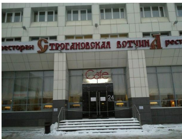
Рисунок 1 - вход в ресторан ООО «Строгановская вотчина»

Юридический адрес: 14000, Пермский край, г. Пермь, ул. Ленина, д. 58, офис 229. Ресторан г. Перми включает в себя 4 зала на 60 мест, 40, 20 мест и 12 мест. На рисунке 1 представлен вход в ресторан.