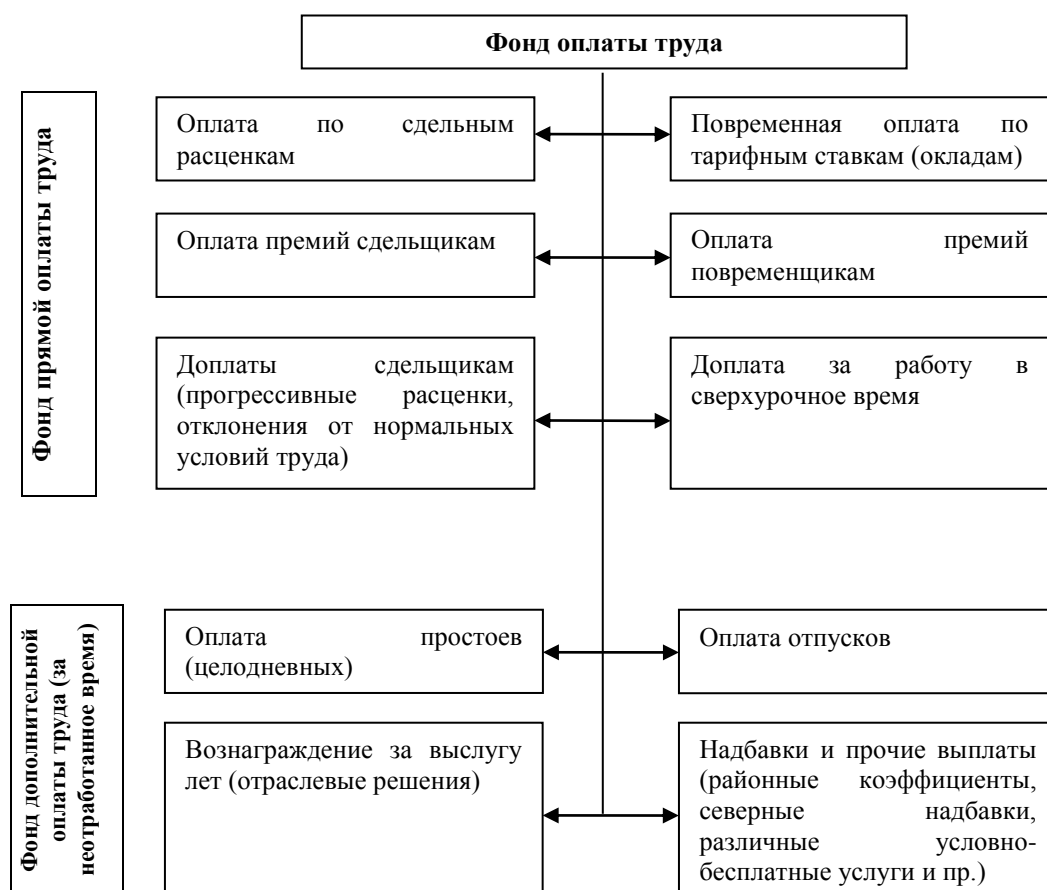
Рисунок 2 – Состав фонда оплаты труда персонала [16, с. 355]

Состав фонда заработной платы наемного персонала НКО представлен схематично на рисунке 2.