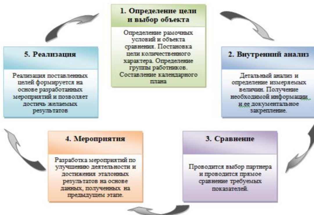
Рисунок 4 – Процессно-ориентированный подход к нормированию труда

Процессно-ориентированный подход предусматривает поддержание и постоянное совершенствование процессов. Основу данного подхода составляет цикл Деминга (PDCA).