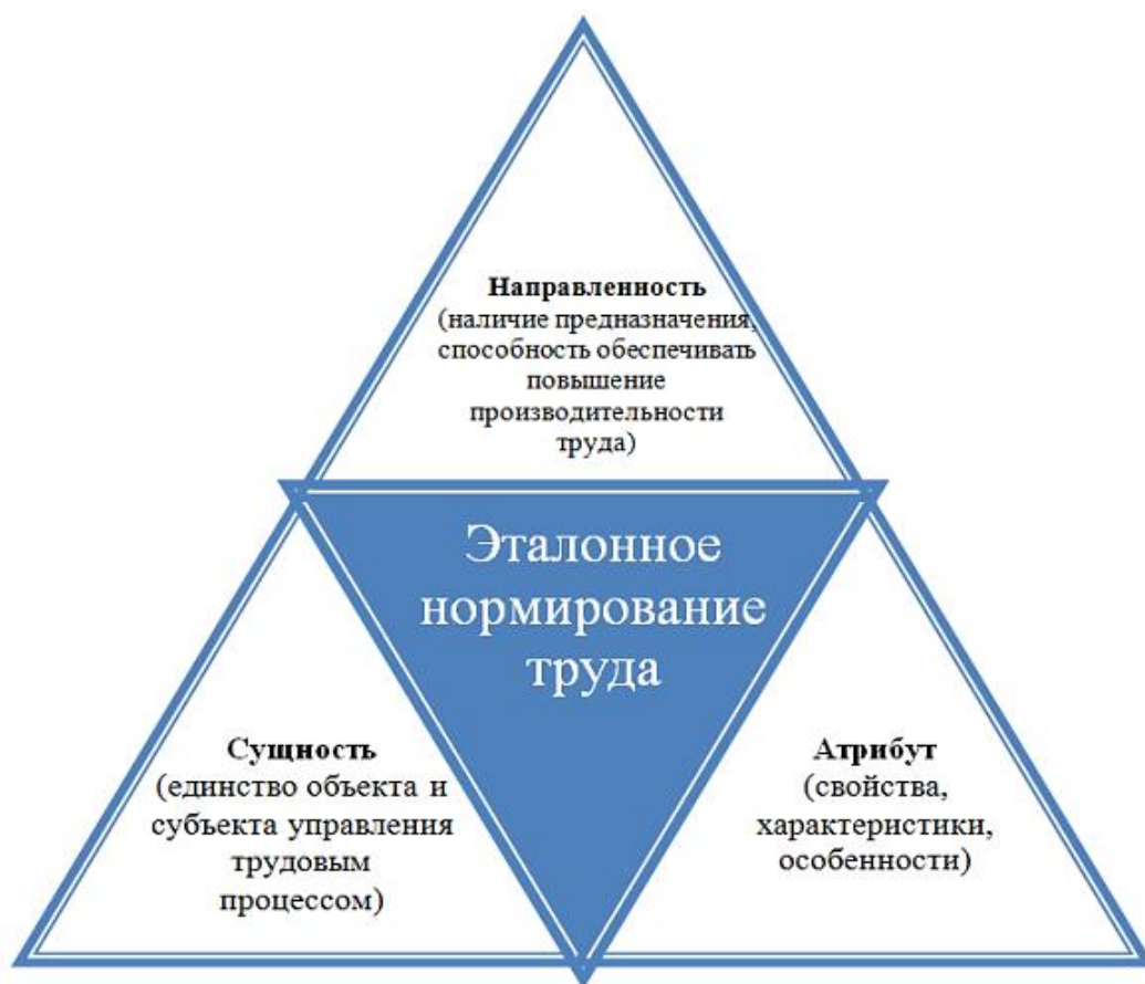
Рисунок 2 – Трехмерная модель эталонного нормирования труда

Чтобы определить уровень нормирования труда на предприятии, рассмотреть его характеристики и особенности, установить оптимальные трудозатраты в целях организации эффективного производственного процесса целесообразно использовать эталонное нормирование труда. Сущность эталонного нормирования труда можно представить в виде трехмерной модели на рисунке 2.