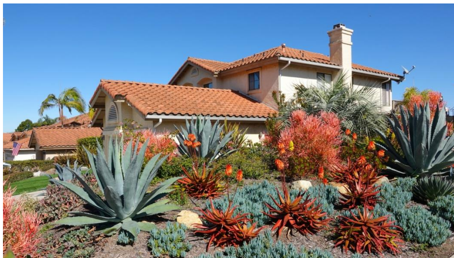
Рис.1. Пример применения метода "Ксерискейпинг"

Xeriscaping создает зеленые насаждения, которые требуют небольшого количества обслуживания и орошения, а также способствуют сохранению биоразнообразия; однако, из-за социальных норм и отсутствия понимания ландшафта, общественное восприятие ксерискейпинга часто было негативным, так как некоторые предполагают, что эти типы ландшафтов представляют собой уродливые просторы, состоящие только из кактусов и гравия 4 . Однако исследования показали, что обучение методам сохранения водных ресурсов и преимуществ ксерискейпинга может значительно улучшить восприятие ксерискейпинга общественностью [5].