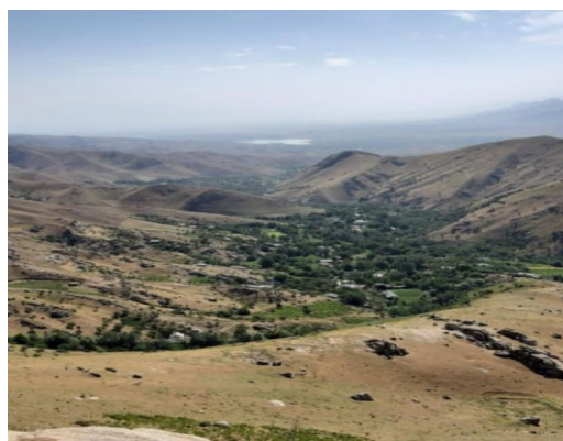
Внешний вид кишлака Узунсой