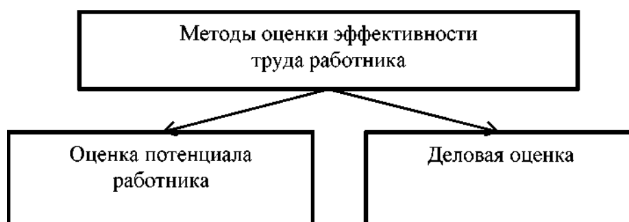
Рис. 2 Методы оценки эффективности труда работника

Данные подходы являются основными аспектами, в которых осуществляет свою деятельность служба управления. Конечная цель —