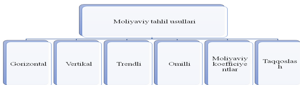
1-rasm. Korxonaning moliyaviy holatini tahlil qilish usullari

IV. bosqich. korxonaning moliyaviy hisobotini prognoz qilish.