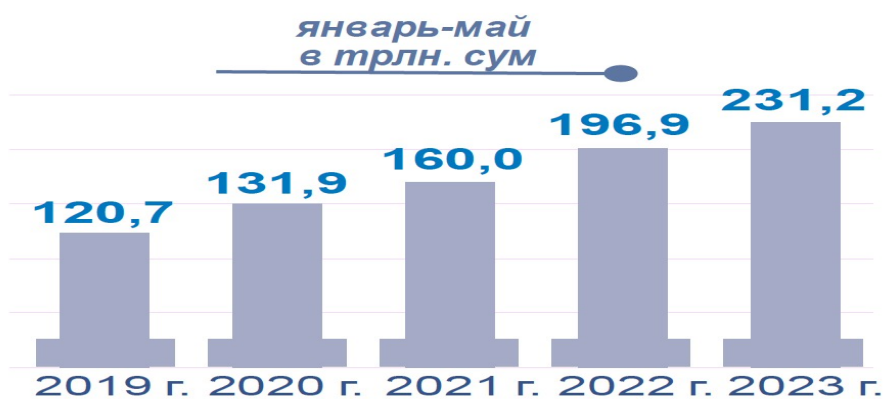
Рисунок 1. Производство промышленной продукции

Промышленность – это отрасль производства, охватывающая переработку сырья, разработку недр, создание средств производства и предметов потребления. По предварительным данным, в январе-мае 2023 года предприятиями республики произведено промышленной продукции на 231,2 трлн. сум, индекс физического объема промышленного производства к аналогичному периоду 2022 года составил 105,7 %.[2]